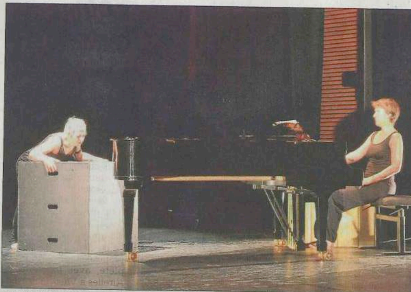
Sur terre chaque objet a une masse, c'est ce que découvre notre héroïne.

Ainsi, la compagnie Une Autre Carmen interprétait un autre Newton, pouvait-on supposer.